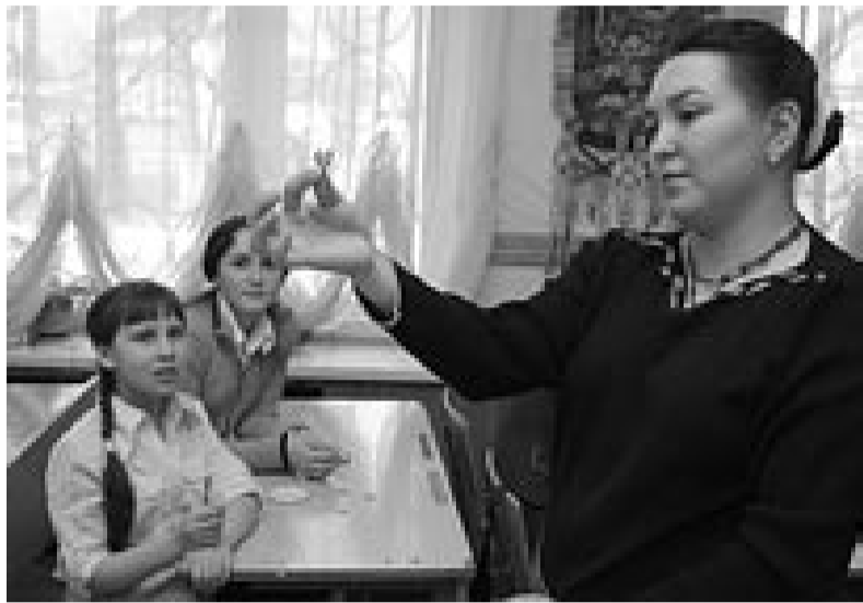
Боле 40 миллионов граждан нашей страны, так или иначе, имеют отношение к системе образования.