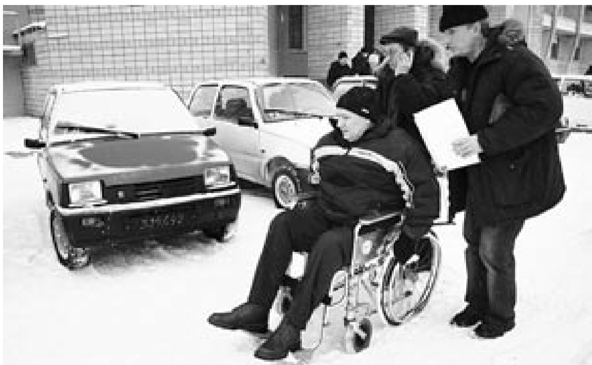
Перед государством стоит задача снизить, а по возможности полностью ликвидировать сохраняющиеся барьеры для инвалидов.

ЗДОРОВЬЕ РОССИЯН – НЕОБХОДИМОЕ УСЛОВИЕ ДЛЯ МОДЕРНИЗАЦИИ