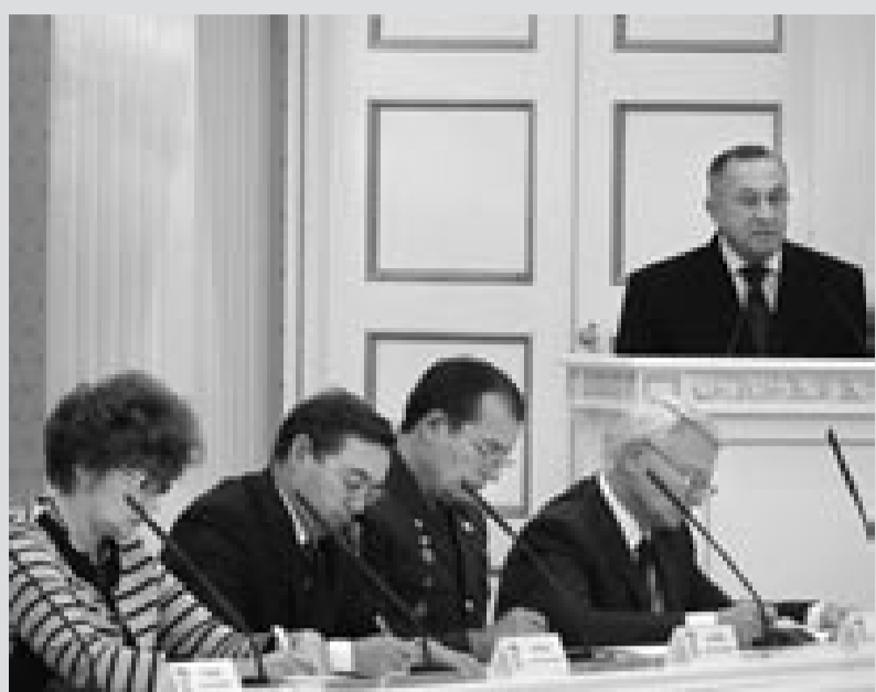
Региональное отделение Партии направит свои предложения в Госсовет, Правительство республики и представителям местной власти.

А самое важное то, что Ижик создавался всем миром, он смог объединить разные поколения. Важно то, что современники заинтересовались историей своего города, вспомнили традиции, почувствовали преемственность эпох. Ижик добрый – в этом его главная ценность.