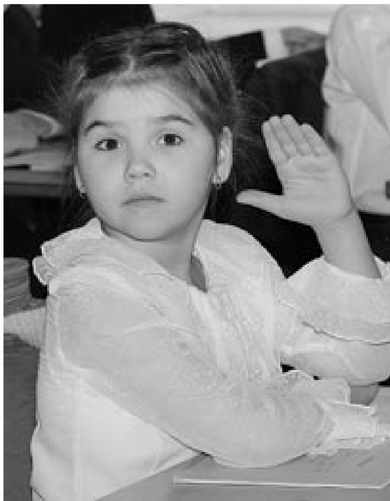
При всей напряженности проект бюджета не только сохраняет свою социальную направленность, но и увеличивает некоторые расходы, в том числе расходы на учебу наших детей.

Работа над бюджетом ведется в напряженном режиме, однако все социальные обязательства, которые возложены на республику, будут выполнены. Конечно, дефицит, который заложен в бюджете, близок к максимально допустимому уровню в 15 процентов. Возрастание долга республики связано с тем, что деньги, выделенные федеральным бюджетом на преодоление последствий засухи и на строительство и реконструк-