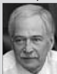
Борис ГРЫЗЛОВ, Председатель Высшего Совета партии «ЕДИНАЯ РОССИЯ»

« Впервые в рамках федерального бюджета отдельной строкой выделены средства на внутридворовые и сельские дороги. На ремонт дорог в городах будет направлено 34 миллиарда рублей, и впервые предлагается две трети этой суммы направить на внутридворовые проезды. Впервые в бюджете отдельной строкой будет выделено 5 миллиардов рублей на ремонт и строительство дорог в селах. »