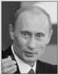
Владимир ПУТИН, Председатель партии «ЕДИНАЯ РОССИЯ»

В целом на мероприятия федеральной программы развития образования планируется выделить 137 миллиардов рублей, в том числе 53 миллиарда рублей из федерального бюджета и 67 миллиардов рублей – из бюджетов субъектов Федерации. За счет внебюджетных источников будет привлечено 17 миллиардов рублей. В рамках данной программы серьезные средства будут выделены для поддержки одаренных детей, а также на создание центров развития талантливой молодежи при федеральных университетах и дистанционных школ при исследовательских университетах. Кроме того, в рамках программы будет продолжено обновление материально-технической базы федеральных вузов. Предстоит разработать и ввести в действие свыше 300 новых программ профессионального обучения, в первую очередь по тем специальностям, которые максимально востребованы на рынке труда.