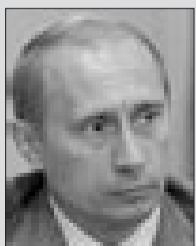
Владимир ПУТИН, Председатель партии «ЕДИНАЯ РОССИЯ»

«К сожалению, сегодня лишь немногим более 2 процентов наших школ приспособлены для обучения детей-инвалидов, то есть имеют необходимые бытовые условия и оборудование. Мы намерены коренным образом изменить эту ситуацию, чтобы к 2016 году уже 20 процентов российских школ должны предоставлять нормальные условия для совместного обучения детей с ограниченными возможностями и их сверстников.»