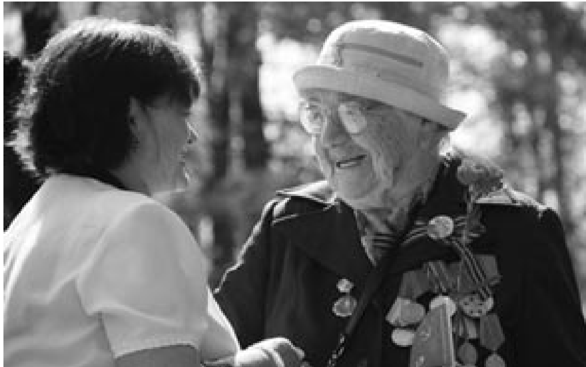
Вопросам развития социальной политики в отношении граждан пожилого возраста и повышения качества их жизни руководители государства уделяют особое внимание.