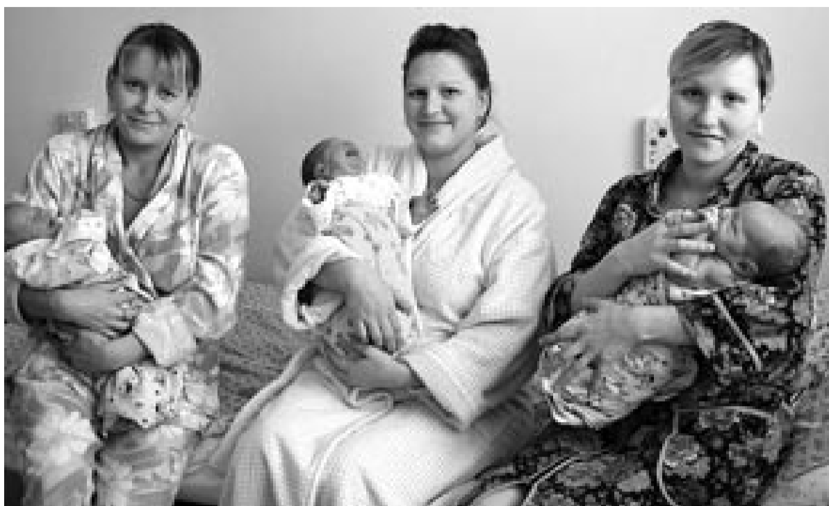
В будущем году будут увеличены материнский капитал, пенсии, пособия по беременности и родам.