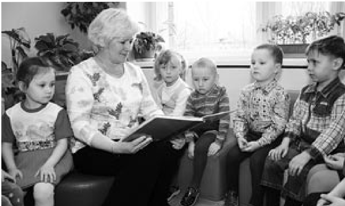
В большинстве субъектов Российской Федерации, в том числе и в Удмуртии, партийный проект «Детские сады – детям» поддержан исполнительной, законодательной властью, общественными объединениями.