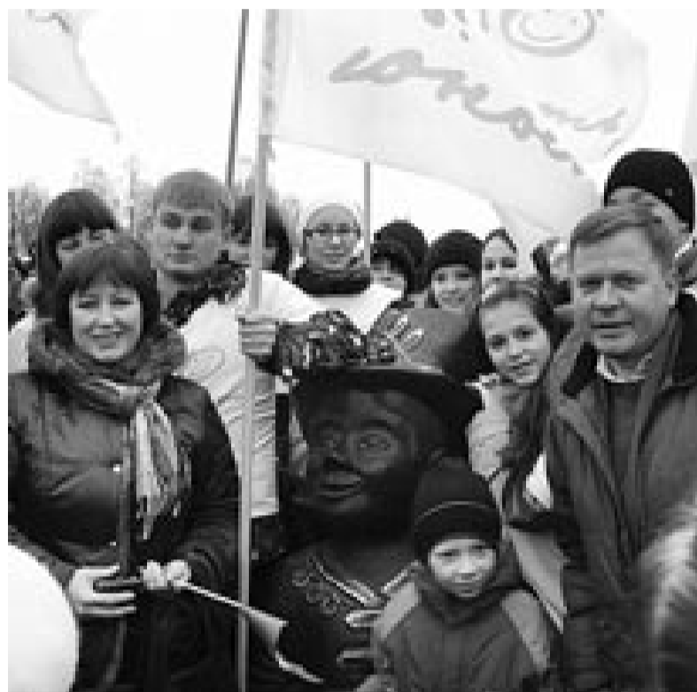
На памятник Ижику ушло почти 20 тысяч ключей общим весом в 180 килограммов.