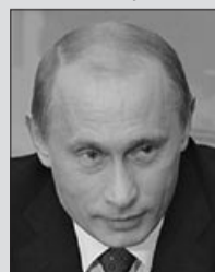
Владимир ПУТИН, Председатель партии «ЕДИНАЯ РОССИЯ»

“ В ближайшие три года экономический спад 2009 года будет преодолен. Для этого разработан документ сценарных условий развития экономики на 2011-2013 годы, который рассчитан на посткризисный период, когда нам предстоит не только полностью преодолеть последствия прошлогоднего спада, но и обеспечить устойчивое развитие. В основу бюджета будет положен консервативный вариант прогноза, то есть такой, который будет использован при любом развитии ситуации. ”