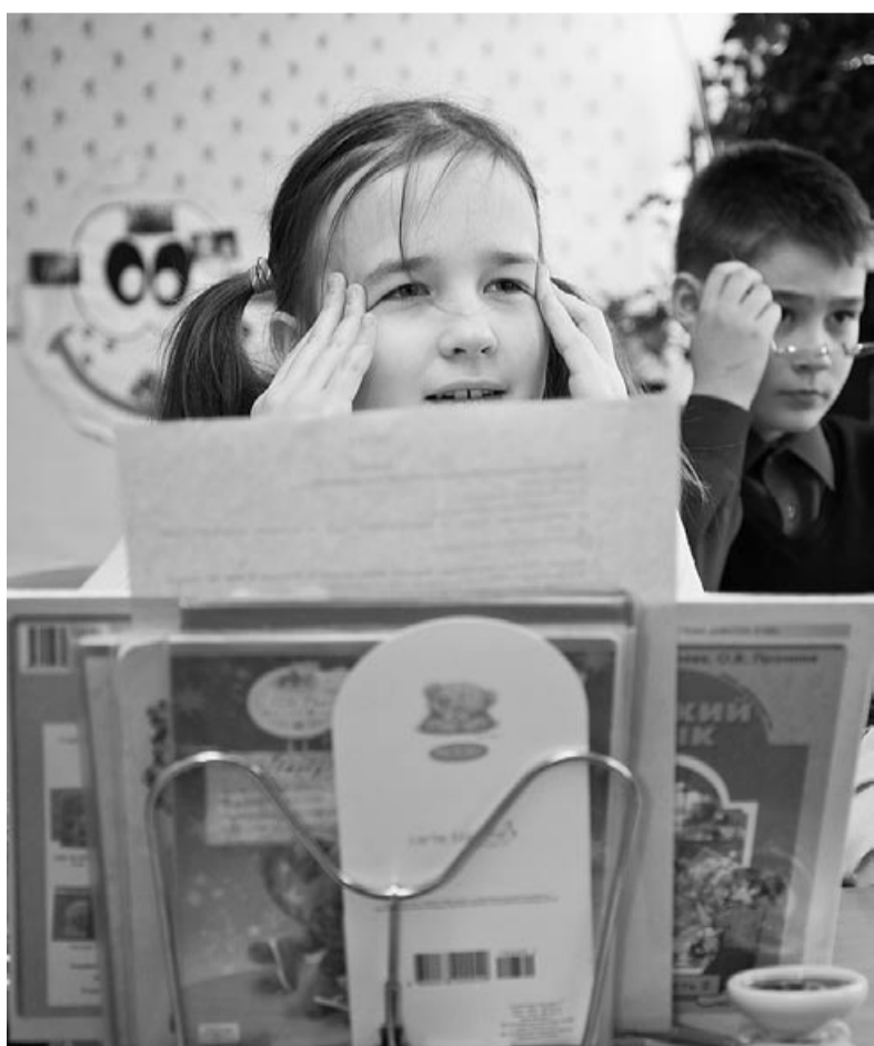
95 процентов родителей говорят о том, что они не успевают отследить и просмотреть всю информацию, которая попадает к их детям.