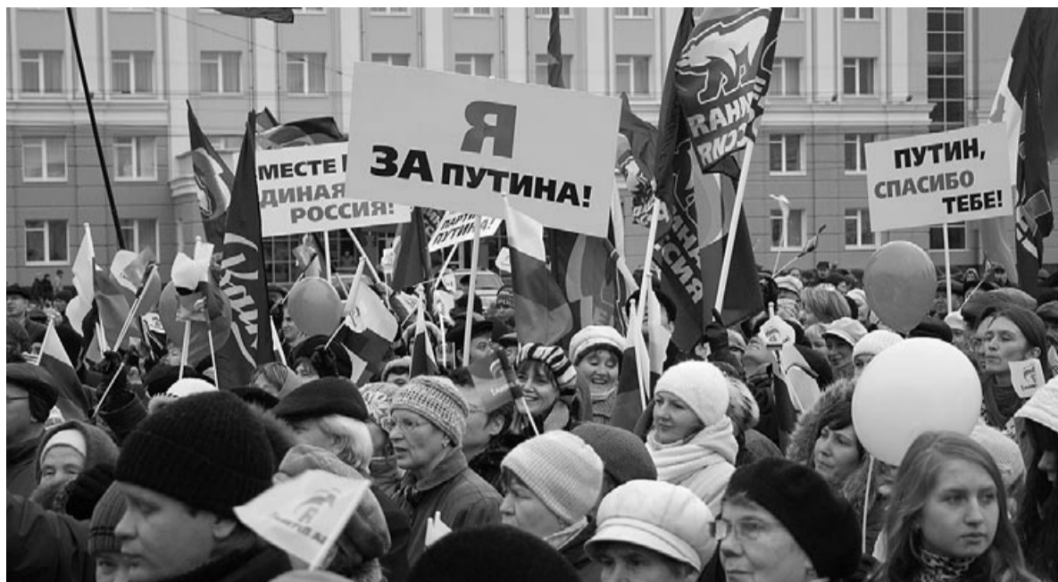
Поддерживают и одобряют деятельность Председателя партии «ЕДИНАЯ РОССИЯ» Владимира Путина более 70 процентов опрошенных жителей городов республики.