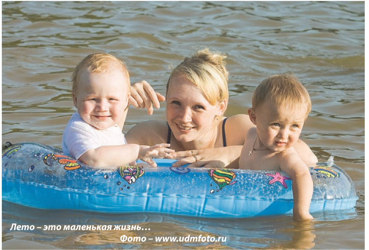
Лето – это маленькая жизнь...

Четвертая – легко добывающие воду и расходующие экономно: томат, морковь, петрушка, бахчевые. Поливы эффективны при правильном и своевременном их проведении. Влаголюбивые культуры наиболее отзывчивы на освежительные поливы в жаркие часы дня таким количеством воды, которое компенсирует ее ежесуточный расход – 2-4 литра на квадратный метр. Менее влаголюбивые растения нужно поливать периодически, компенсируя расход воды за этот период. Небольшие участки лучше поливать в конце дня, когда уменьшается испарение воды и лучше увлажняется почва.