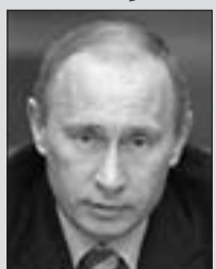
Владимир ПУТИН, Председатель партии «ЕДИНАЯ РОССИЯ»

«Народность партии определяется на выборах. Голосует народ за партию – значит, она народная. Не голосует – значит, это группа лиц, объединенных определенной идеей, но пока эти идеи не приобрели устойчивой поддержки со стороны избирателей.»