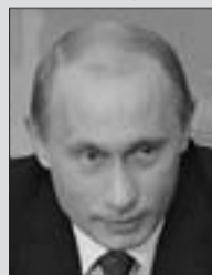
Владимир ПУТИН , Председатель партии «ЕДИНАЯ РОССИЯ»

«Мы, конечно, окажем финансовую помощь пострадавшим регионам, предоставим им бюджетные кредиты. Но и сами регионы также должны выделить из своих бюджетов ресурсы на поддержку сельхозпредприятий, пострадавших от засухи. Ситуация сложная, но хочу при этом подчеркнуть: у нас есть серьезный запас прочности, резервы, накопленные за прошлые годы, позволяют нам гарантировать стабильность сельского хозяйства и полностью обеспечить внутренние потребности страны в зерне.»