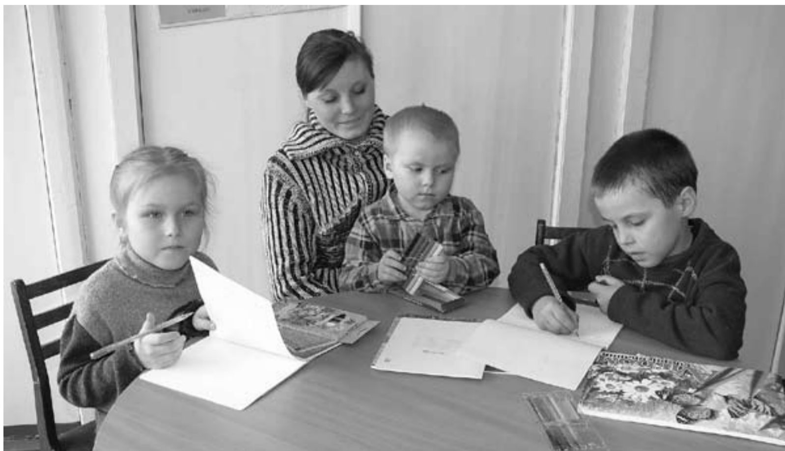
Если ранее средства материнского капитала были, скорее, виртуальными, то в 2009 году женщины получили возможность использовать на любые нужды 12 000 рублей из этой суммы.

С июня 2009 года материнский капитал не только увеличился, но и заработал, что называется, в полную силу. Если ранее средства материнского капитала были, скорее, виртуальными, то в 2009 году женщины получили возможность использовать на любые нужды 12 000 рублей из этой суммы. В Воткинске, Воткинском