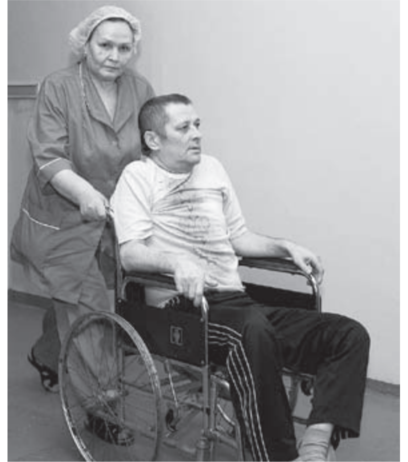
После принятия закона об обязательном медицинском страховании пациенты смогут выбирать и больницу, и врача, потому что бюджет будет оплачивать работу конкретной больницы и конкретного медицинского персонала.

Удмуртия занимает первое место в округе по числу новорожденных. Третье место республика занимает по смертности. По