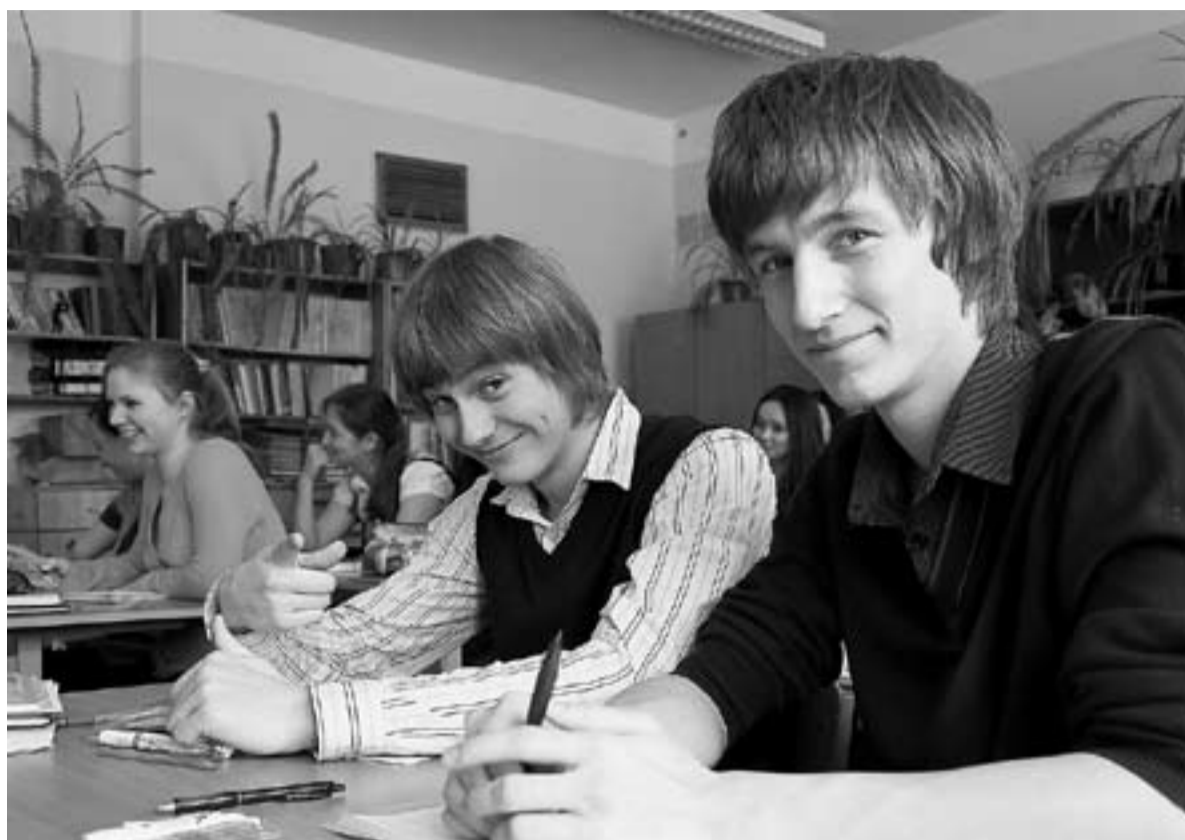
Задачи национальных проектов настолько значимы для общества, что государство приняло решение об их продолжении. И это понятно – будущее страны должно быть здоровым и образованным.

Внимание государства к сфере здравоохранения помогло стабилизировать эпидемическую ситуацию. Так, большое внимание уделяется сегодня иммунизации населения в рамках национального календаря прививок, дополнительной иммунизации. Все эти мероприятия ведут к снижению заболеваемости, а случаи таких забо-