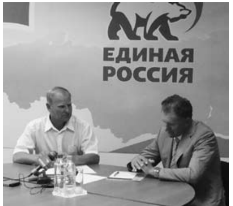
Президент Удмуртской Республики провел очередной прием граждан в региональной Общественной приемной лидера партии «ЕДИНАЯ РОССИЯ» Владимира Путина.