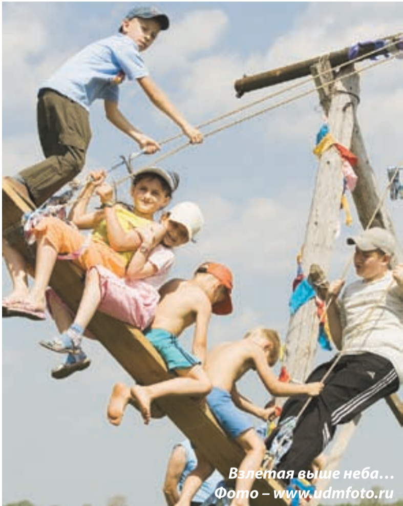
Взлетая выше неба...