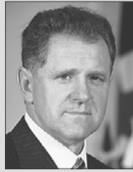
Александр ВОЛКОВ, Президент Удмуртской Республики

“ Смысл проекта «Народная программа. Вперёд, Удмуртия!» я вижу в том, чтобы привлечь к работе по развитию республики как можно больше активных и неравнодушных людей. Нам нужны их предложения, направленные на улучшение положения, решение актуальных проблем самого разного масштаба – от благоустройства двора, ремонта тротуара до инновационных проектов. Не нужно обещать людям всё и сразу. Эти предложения мы должны собрать, систематизировать и выстроить по степени важности и в соответствии с нашими возможностями. Что-то из предложенного можно будет реализовать, что называется, завтра, что-то – в течение года, а что-то – через год или два. Главное – услышать людей и сделать все, чтобы решить их проблемы. ”