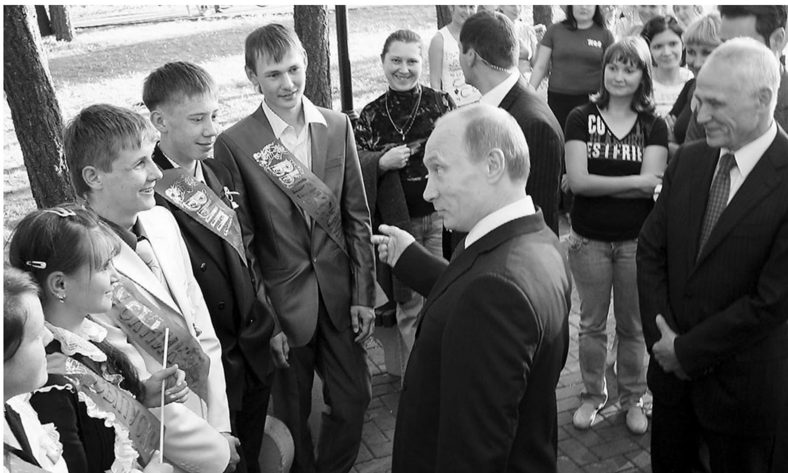
Рейтинг Владимира Путина находится на очень высоком уровне: сегодня почти 70 процентов населения страны по-прежнему доверяют Путину.

Практически все современные политические партии России прочно ассоциируются у избирателей с их лидерами. Что будет с ЛДПР, когда с политической сцены уйдёт Жириновский? Что стало с «Яблоком» после ухода Явлинского? «Единая Россия» – не исключение. В глазах населения это по-прежнему партия Путина. Да, Партии с лидером, безусловно, повезло. Несмотря на экономические неурядицы последних лет, рей-