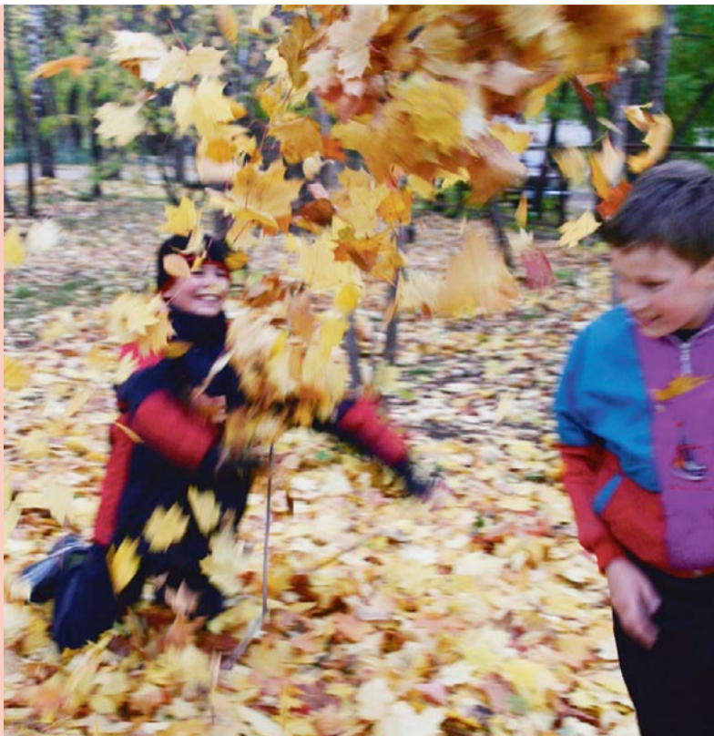
Опавшие осенние листья – полезное и бесплатное удобрение садовой земли.

Сбор опавших листьев – работа трудоемкая, отнимающая немало времени и сил. Где хранить собранные опавшие листья? Как от них избавиться? Оказывается, из них можно сделать листовую перегной – действенное средство, улучшающее структуру почвы, отличная мульча и подкислитель для некоторых растений. Собранные листья следует увлажнить, плотно уложить и утрамбовать. Листовой перегной почти не содержит питательных веществ, поэтому не может использоваться в качестве удобрения. Его достоинства – в кондиционирующих почву свойствах. Такая почва дольше задерживает влагу у корней растений, помогая им пережить летнюю засуху. Перегной – любимое место обитания дождевых червей, больших помощников садовода. Листовой перегной – прекрасное добавление к садовому компосту. К тому же листья не придется сжигать и не мучить себя и соседей едким запахом и дымом. Можно разложить мокрые опавшие листья на пустующих участках земли. Листья послужат естественной мульчей, которая препятствует росту сорняков, выветриванию почвы и вымывания из нее минералов. Весной можно собрать полуперепревшие листья граблями либо перекопать вместе с грунтом. Немного опавших листьев (лучше измельченных) до-