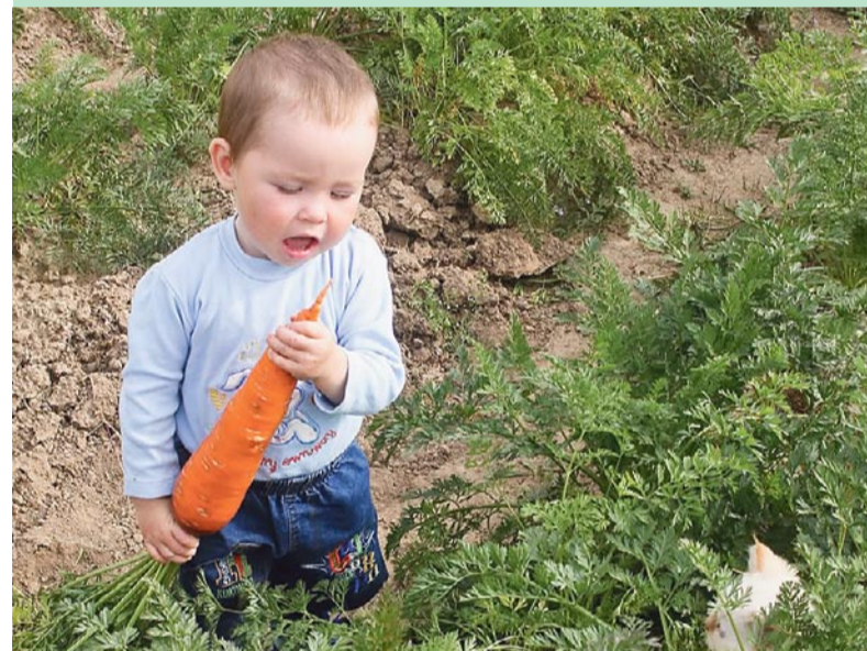
Морковка поможет улучшить память и взрослым, и детям.

Голубика и черника, помимо витаминов, в своем составе содержат еще и полезную аминокислоту Омега-3, а также протеины, улучшающие работу мозга. А вот в клюкве содержится рекордное количество антиоксидантов, которые нейтрализуют действие вредного холестерина.