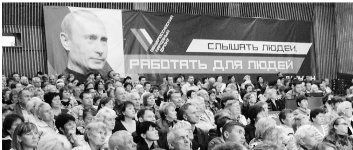
Можгинцы с интересом и надеждой отнеслись к общественным слушаниям.