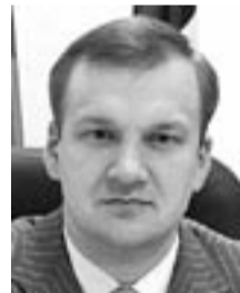
ГРАФИК ПРИЕМА ГРАЖДАН

депутатами фракции «ЕДИНАЯ РОССИЯ» Госсовета Удмуртской Республики