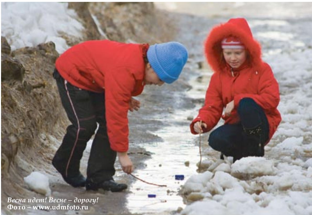
Весна идет! Весне – дорогу!

Ученые советуют добавить в арсенал средств по борьбе с симптомами авитаминоза весной еловую хвою. По данным исследований, хвоя содержит полезное сочетание эфирных масел, органических кислот и витаминов С и К. Оптимальным способом ее употребления является вот этот напиток. Еловую хвою измельчить, залить водой и прокипятить на слабом огне 30 минут. Можно добавить в напиток немного лимонного сока. Процедить и добавить чайную ложку меда. Пить этот витаминный коктейль следует три раза в день по половине стакана.