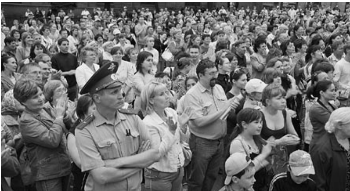
Прощай, милиция! В новом законе повышается значимость общественного контроля над полицией и определены полномочия республиканских органов власти по контролю над действиями полиции.