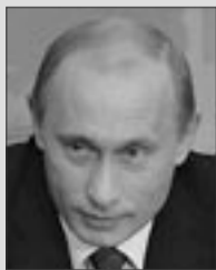
Владимир ПУТИН, Председатель партии «ЕДИНАЯ РОССИЯ»

“ По итогам каждого года будем смотреть, как реализуются региональные программы, как достигаются целевые ориентиры по строительству и вводу жилья. Со своей стороны намерены поощрять инициативу регионов, оказывать финансовую помощь тем субъектам, которые добиваются лучших показателей в развитии жилищного строительства. На эти цели в федеральном бюджете заложено 21 миллиард рублей. ”