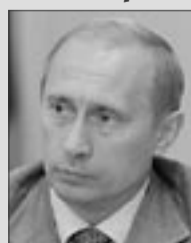
Владимир ПУТИН, Председатель партии «ЕДИНАЯ РОССИЯ»

Мы определили максимальный порог роста коммунальных тарифов в этом году – 15 процентов. Рассчитываю, что он в итоге будет меньше – 13-14 процентов. Во всяком случае, не будет превышать 15. Вновь хочу обратить внимание местных властей – ситуацию с тарифами нужно держать на постоянном контроле. В целом положение дел в ЖКХ – это один из приоритетов муниципалитетов, и особенно все, что касается деятельности управляющих компаний.