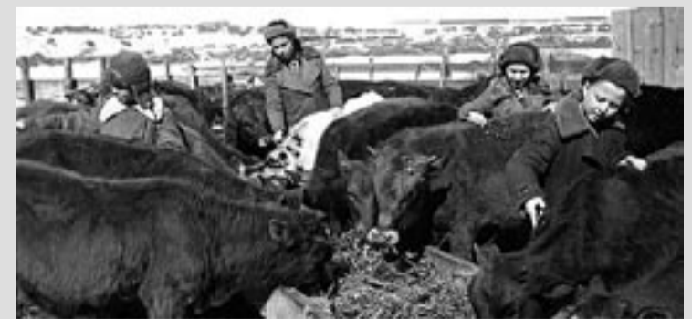
1942 год. Школьники помогают на ферме.