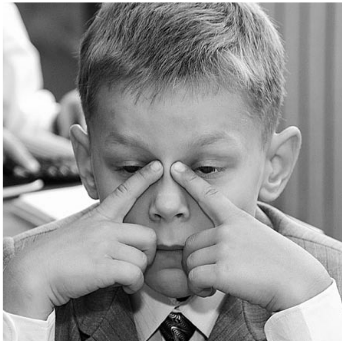
Педагоги, ученые, родители активно обсуждают предстоящее нововведение. А ведь главная роль в реформе будет отведена ученикам. Именно им, по замыслу реформаторов, предстоит самостоятельно определять круг изучаемых предметов, анализировать положение России в мире и активно улучшать здоровье на уроках физкультуры.

– Бесплатное образование никто не убирает: идёт его упорядочивание. В вузах сокращение количества бюджетных мест будет проходить только пропорционально снижению количества учеников по самым невостребованным специальностям – юристы, экономисты. Государству сегодня важнее, чтобы было больше инженеров, механиков, чем экономистов, поэтому оно будет больше бесплатных мест отдавать туда. Я недавно был в авиационном институте. Там на профильной специальности – конструирование самолетов – учится 700 человек. Остальные 10-12 тысяч – это экономисты, юристы, менеджеры. Сегодня найти сварщика 6-го разряда со всеми допусками (сварка под давлением, газопроводов и т.п.) очень сложно. Эта профессия более дефицитна, чем депутат Государственной Думы.