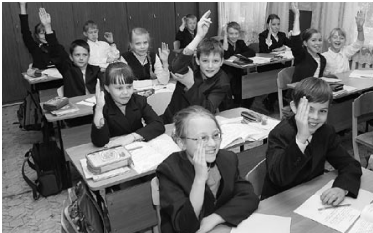
Образование касается каждого, большинство семей воспитывает детей, и все родители желают, чтобы их дети, внуки получили достойное образование.