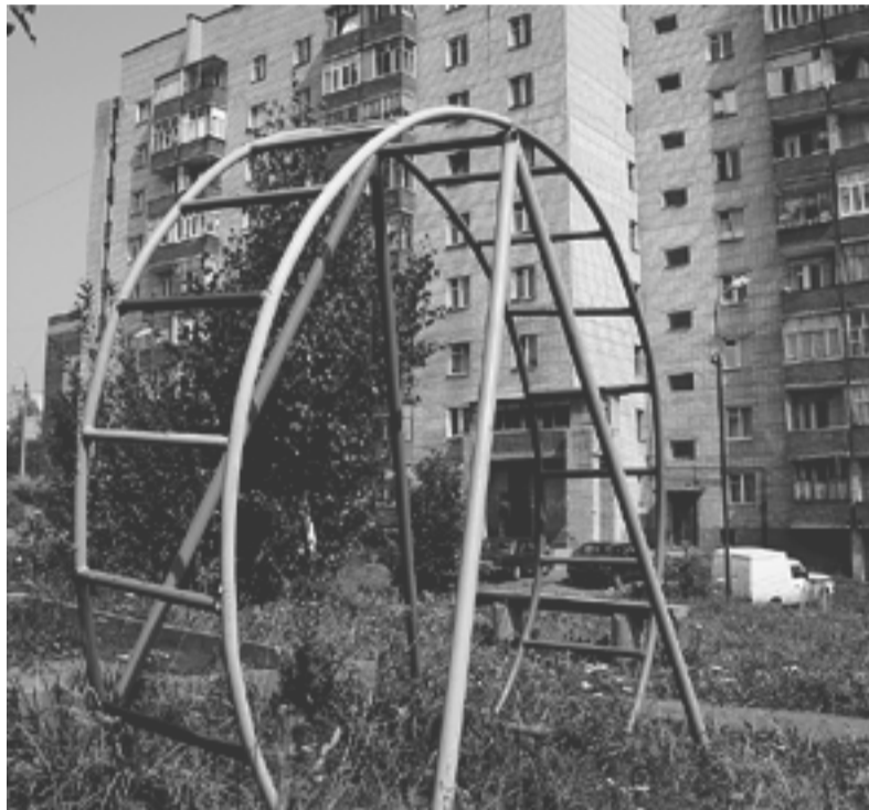
Такое благоустройство дворов под силу многим управляющим компаниям.