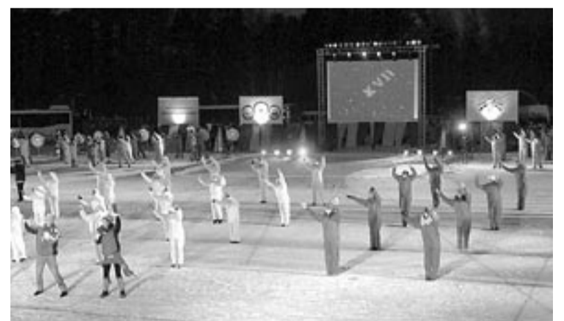
Игры начались с церемонии открытия новой лыжной базы с освещенной лыжной трассой и продолжились на центральном стадионе города, где собрались команды всех районов республики.