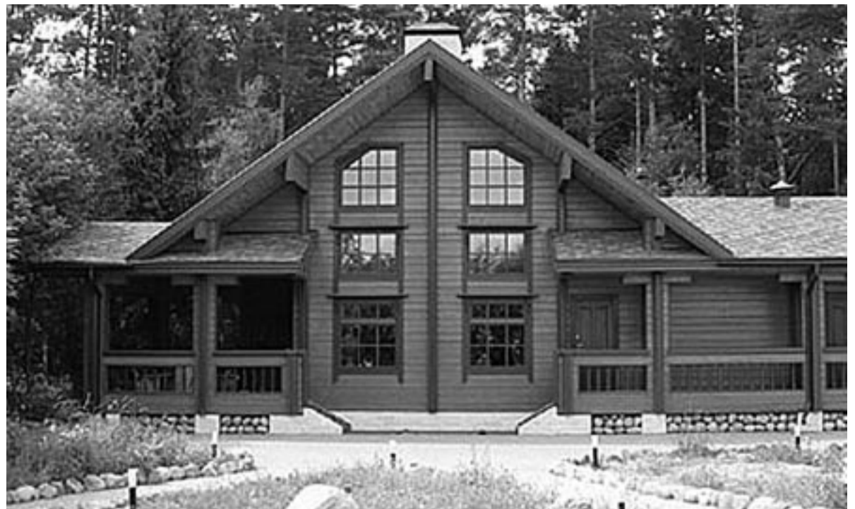
Теперь гражданин может выбрать – переселиться ему в высотку или частный дом, такое право дает закон «О внесении изменений в Федеральный закон «О Фонде содействия реформированию ЖКХ».

– Мы ничего не стали придумывать, просто провели большие маркетинговые исследования в регионах Российской Федерации. Исследование показало, что простые люди относят к эконом-классу дом с участком в 8–10 соток, площадью от 80 до 120 квадратных метров, стоимостью не дороже 3 млн рублей – это среднестатистические показатели по регионам. При этом обязательно наличие всей инфраструктуры: детские сады, школы, поликлиники и т.д.