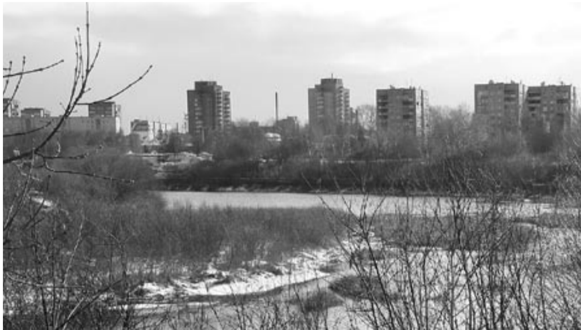
Глазов – один из немногих моногородов России, имеющих свой комплексный инвестиционный план модернизации города.