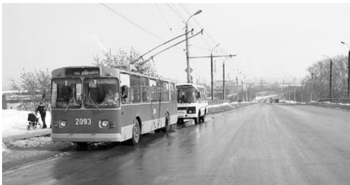
В прошлом году дороги, которые нуждались в первоочередном ремонте, выбирали сами ижевчане.

Эта организация несет материальную ответственность за своих членов. Для этого каждая управляющая компания, вступившая в организацию, перечисляет на специальный неприкосновенный счет членские взносы, поделенные в зависимости от количества квадратных метров жилья, находящегося в управлении. Так создается компенсационный фонд, который позволяет страховать риски компаний. Если компания исчезает с рынка (обанкротится), обязательства перед собственниками за нее выплачивает саморегулируемая организация. Пример использования компенсационного фонда уже есть. В Архангельске эта организация компенсировала ущерб собственникам после