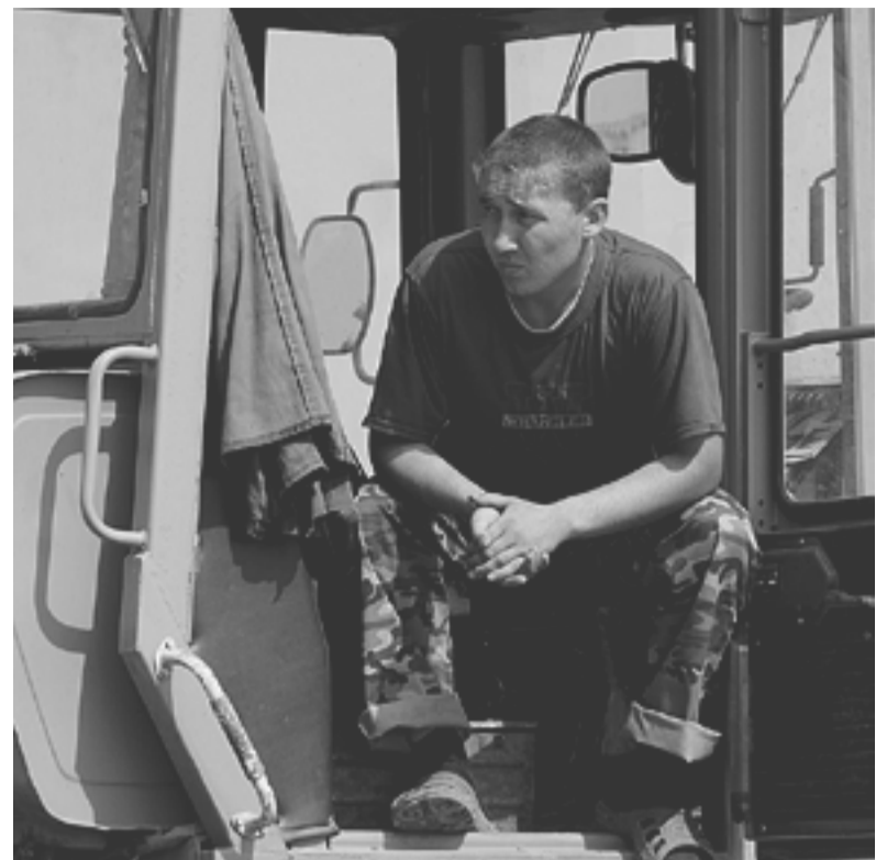
Селяне надеются, что к весне в стране наведут порядок на бензозаправках и сумеют призвать недобросовестных продавцов к порядку.