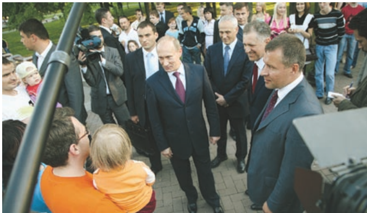
Председатель Партии Владимир Путин – самый влиятельный политик в Российской Федерации, его поддерживает более 80 процентов населения страны.

Владимир Путин, лидер Партии, премьер-министр Правительства Российской Федерации, не исключил, что может возглавить список единокороссов на парламентских выборах, которые пройдут 4 декабря 2011 года