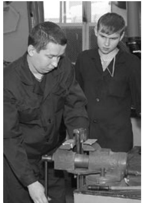
Главный источник доходов государства, прибавочной стоимости на любом предприятии – рабочий человек на рабочем месте.

– В Удмуртии наша профсоюзная организация, работая с региональной властью, давно перешла эти рубежи. Мы приняли эту норму в 2010 году и подписали трехстороннее соглашение, – подчеркнул Орлов. – Прави-