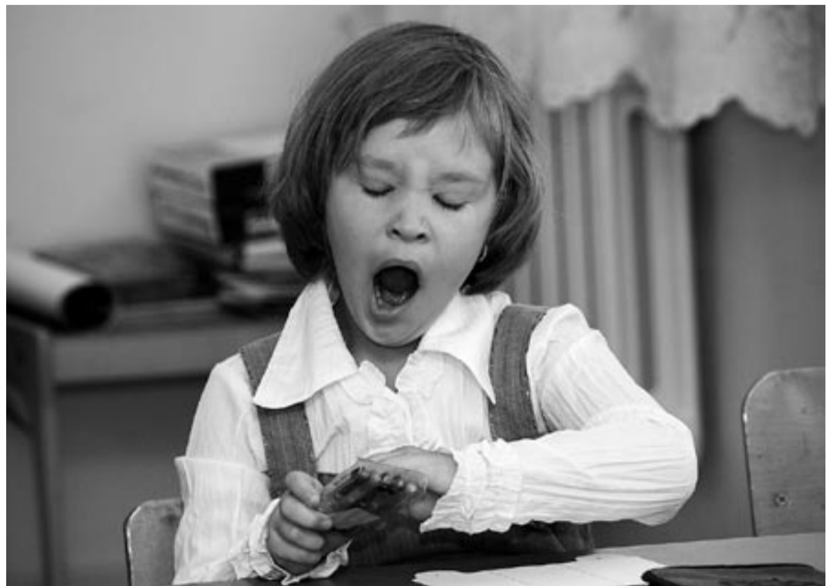
Ученые единодушны: перевод часовых стрелок отражается на детях. Официальная статистика также говорит о том, что в период перевода часов количество обращений в больницы резко увеличивается.

– Перевод часовых стрелок отражается на детях, на пожилых людях. Здесь мы полностью бьем по ним. Официальная статистика также говорит о том, что в период перевода часов количество обращений в больницы резко увеличивается. Особенно в крупных городах. Отрицательное влияние перевода часовых стрелок на здоровье граждан должно играть решающую роль при отмене перехода. Уже потом надо считать экономические выгоды или потери. Лично я выступаю за отмену перехода.