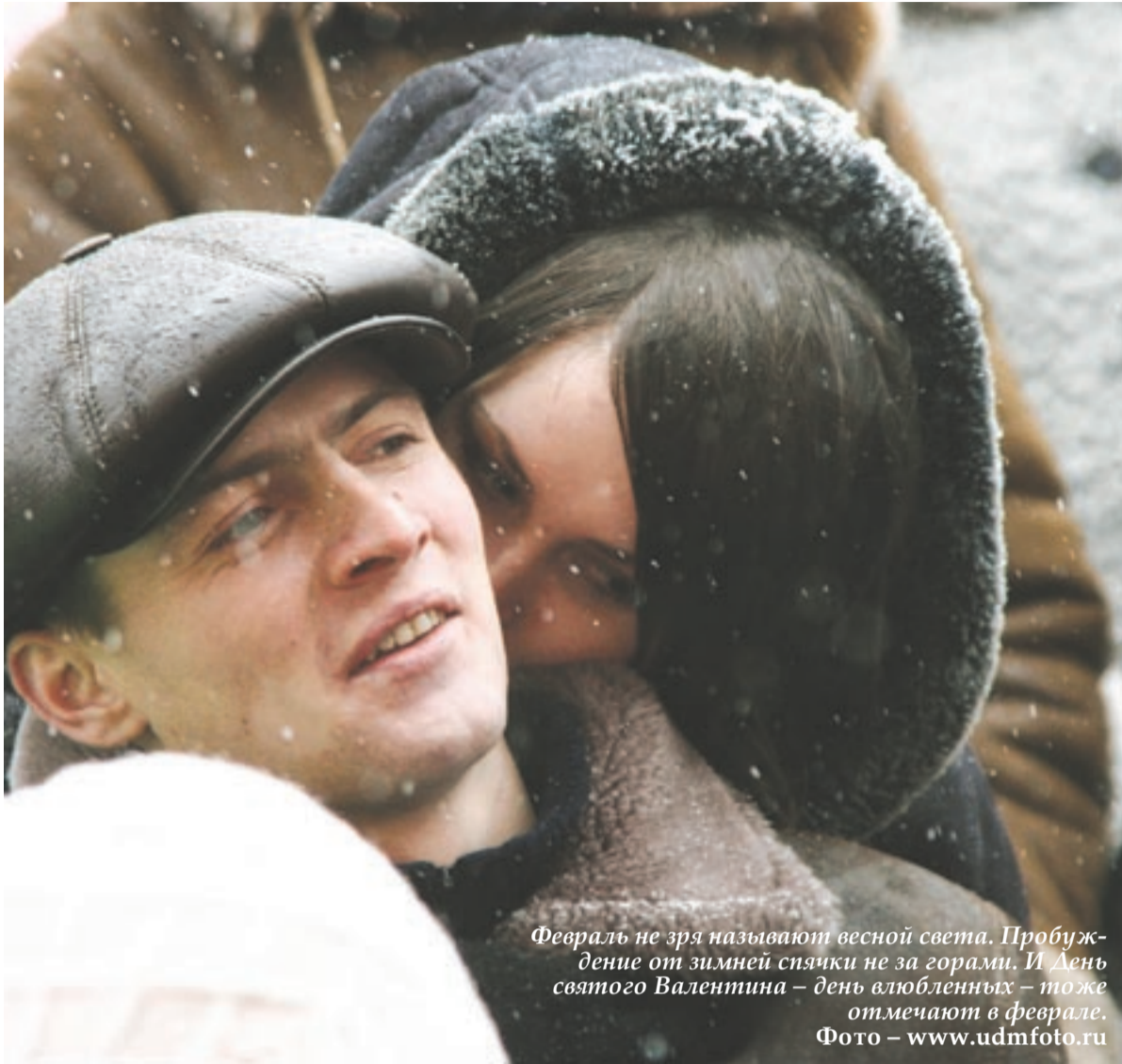
Февраль не зря называют весной света. Пробуждение от зимней спячки не за горами. И День святого Валентина – тоже отмечают в феврале.