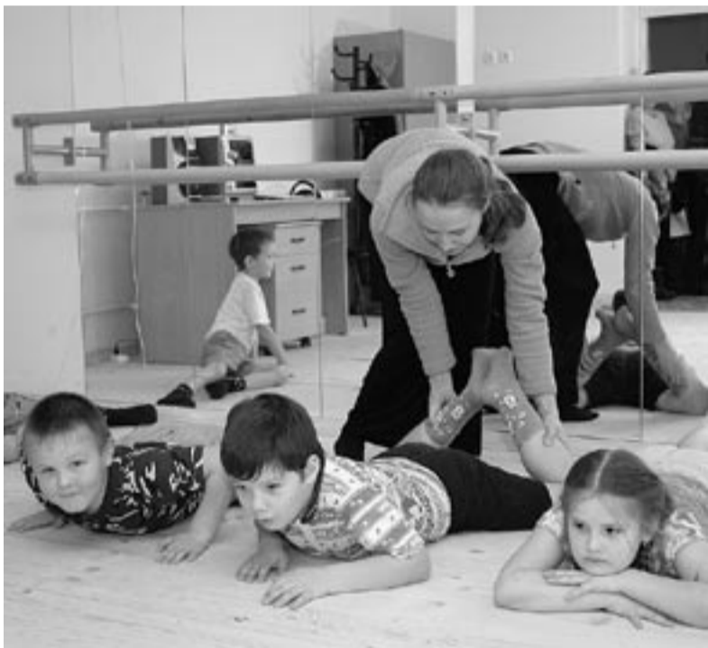
На реализацию мероприятий программы «Дети Удмуртии» в 2011 году бюджетом Удмуртской Республики предусмотрено финансирование в размере более 91 миллиона рублей.

Улучшению демографической ситуации в Удмуртской Республике во многом способствуют мероприятия, реализуемые в рамках республиканских целевых программ