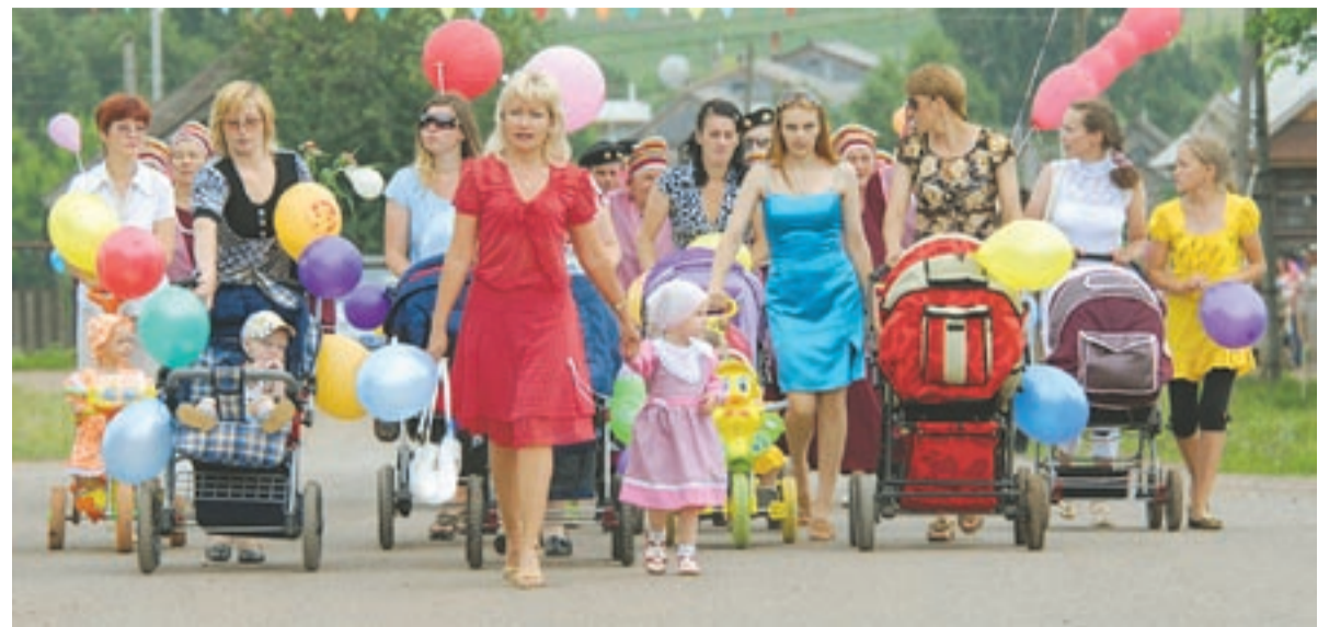
Женщины, знайте: те, у которых отпуск по беременности и родам наступит после 1 января 2011 года, пособие будет исчисляться из заработка за 2009 и 2010 календарные годы.

Законопроект предполагает также дополнительные меры по защите информации, содержащейся в контрольных измерительных ма-