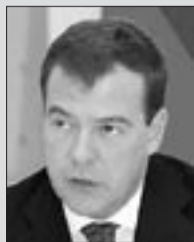
ДМИТРИЙ МЕДВЕДЕВ, Президент Российской Федерации

Планируется направить 3 млрд рублей на поддержку проектов, которые совместно будут реализовывать ведущие научные организации и вузы.